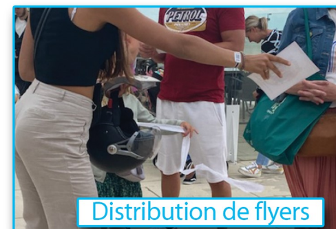
Distribution de flyers